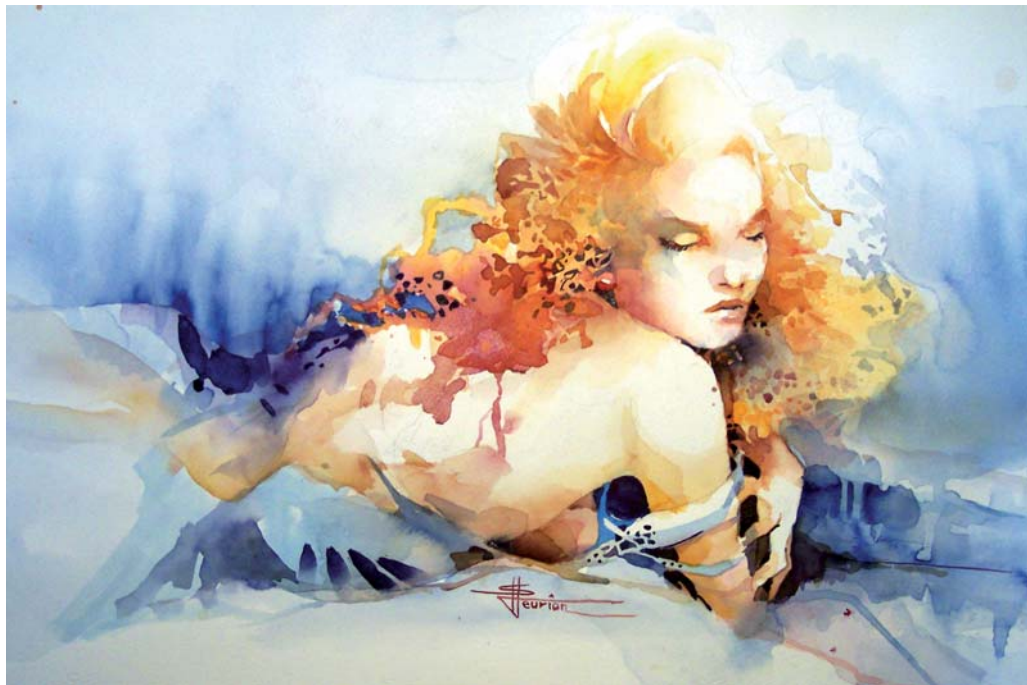
Stéphane HEURION Belgique